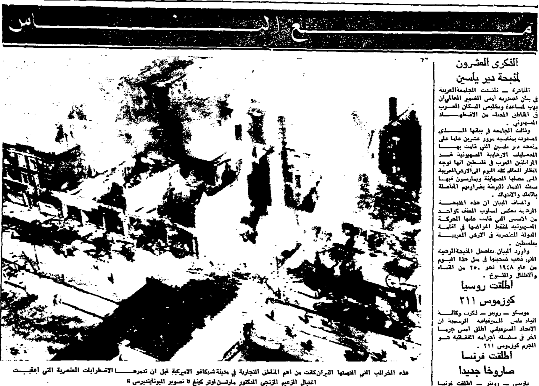
هذه الخراب التي انصبتها القنابل من ام المناطق التجارية في مدينة شيكاغو الامريكية قبل ان تدمرها الاضطرابات العنصرية التي اعتبقت اغتيال الزعيم الرئاسي الكونجور مارتن لوتر كينج « تصوير اليونانيديريسي »